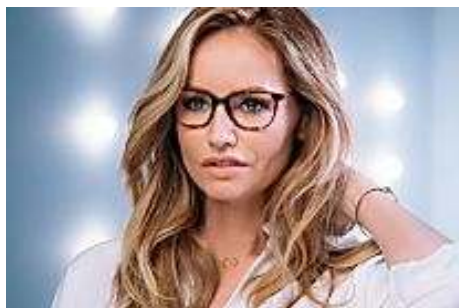
Les dangers et les bienfaits de la lumière bleue !