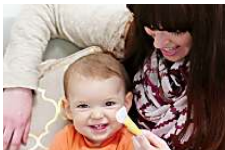
Construisez vous-même une marionnette pour vous amuser avec votre bébé !