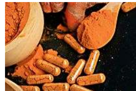
Les incroyables vertues polyvalentes du curcuma