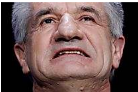
La déclaration de patrimoine de Jean Lassalle