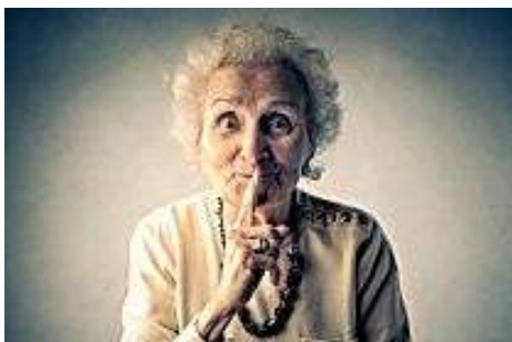
Flore intestinale : les secrets des centenaires enfin percés