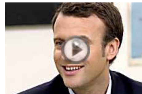
Pourquoi Emmanuel Macron n'a pas d'enfant ?