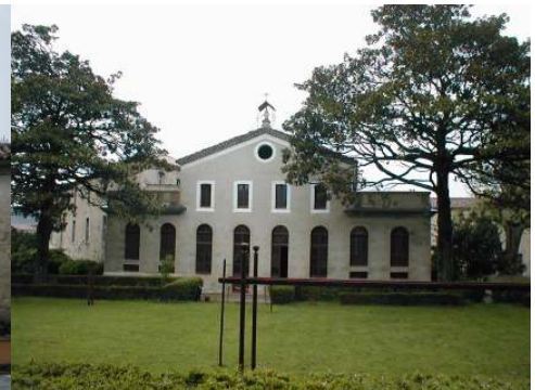
Les bâtiments cour des bleus