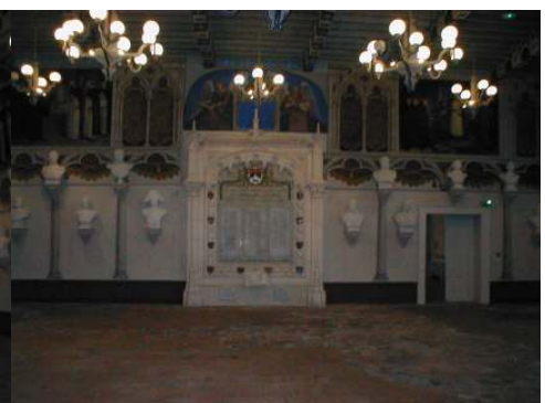
La Salle des Illustres