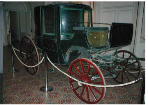
La Salle Centrale et le « bolide » du Père Lacordaire