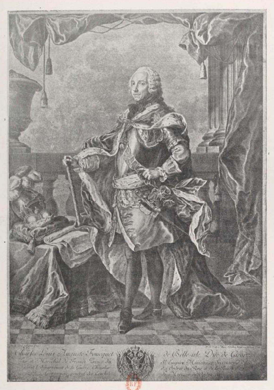
MARÉGHAL DE BELLE-ISLE.