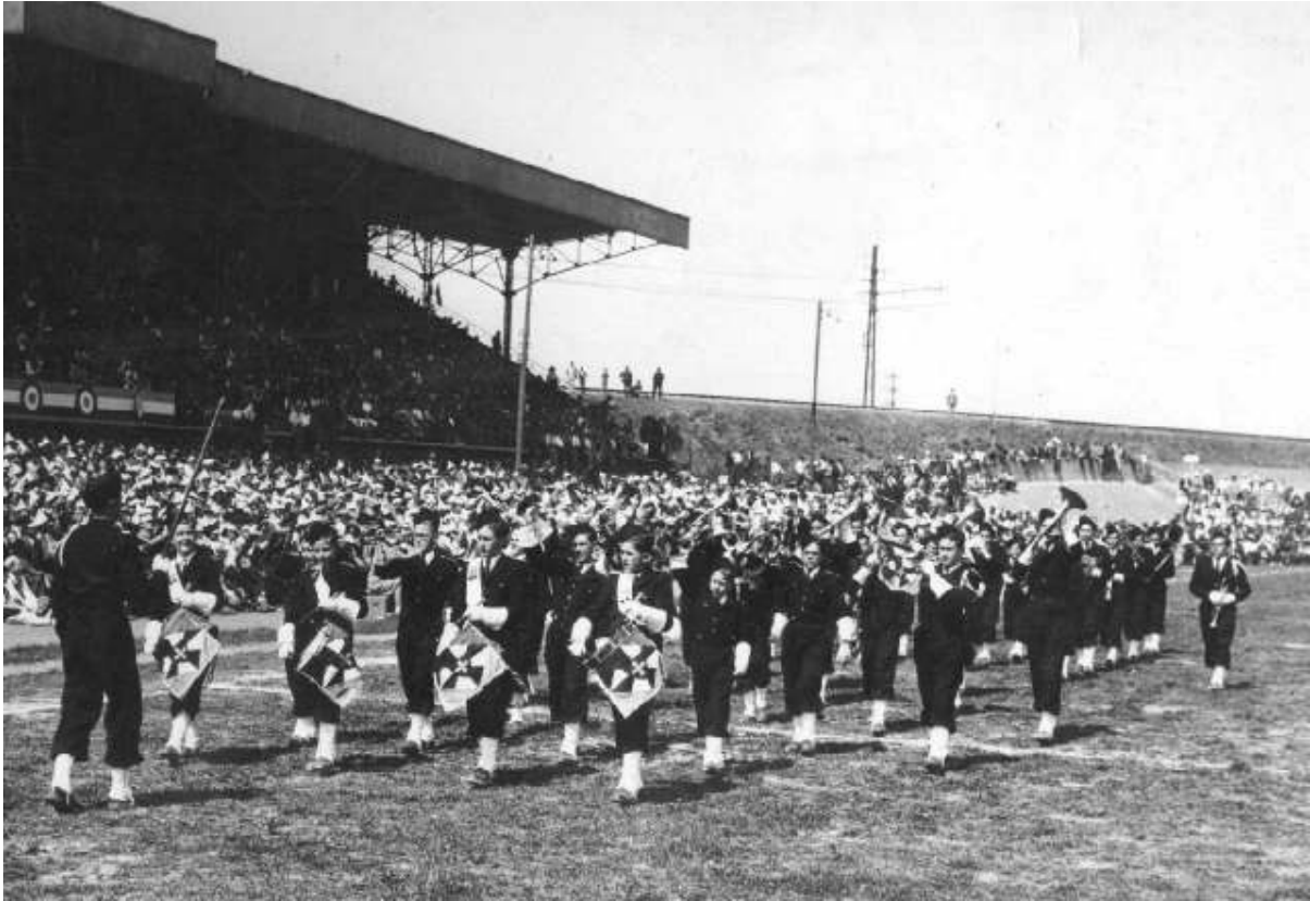
La fanfare à Carcassonne pour la finale du championnat de rugby à 13 en 1949