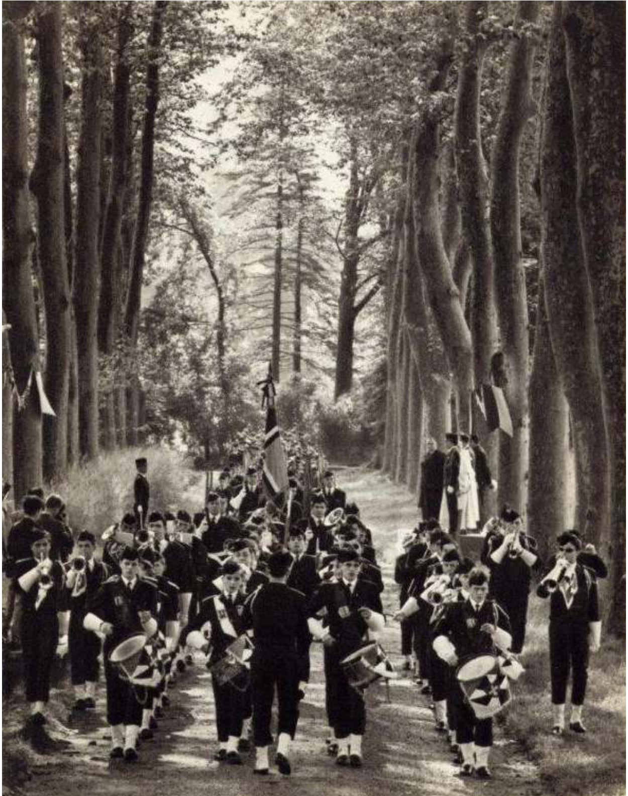
La fanfare en 1965