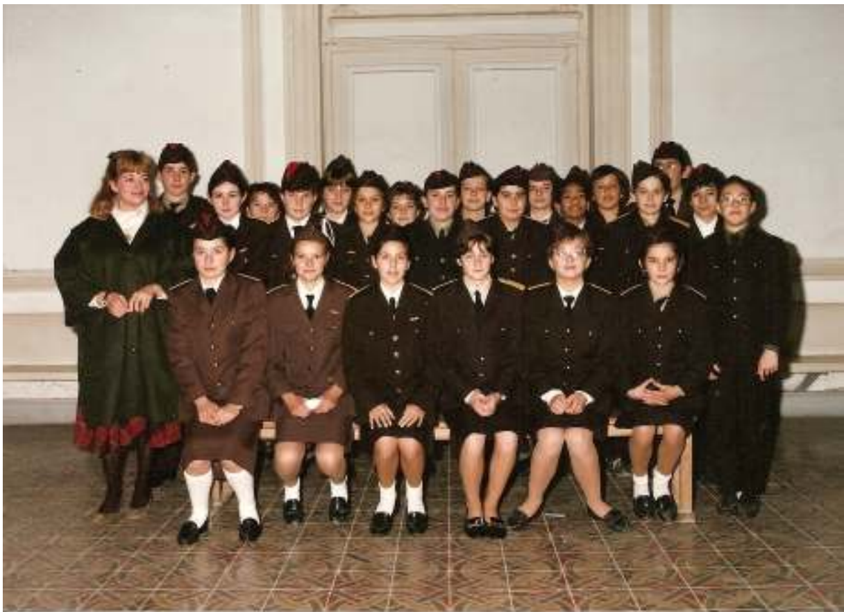
Classe de cinquième 1985-1986