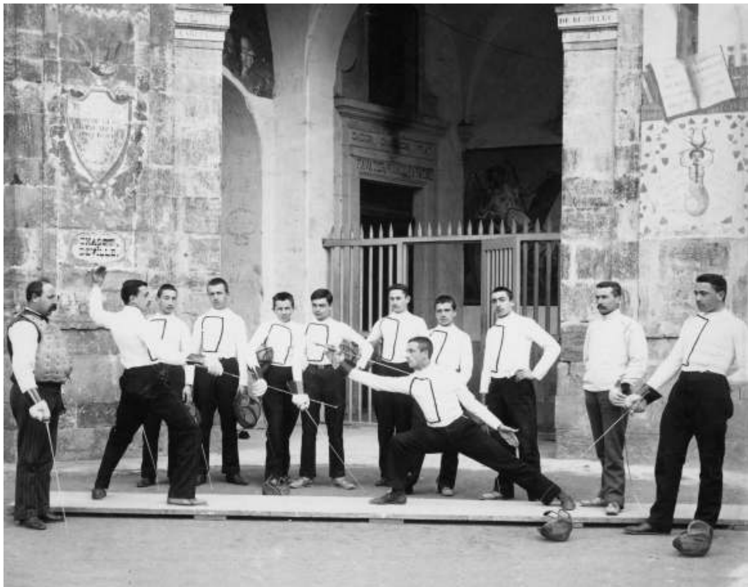
Esgrime au début du siècle