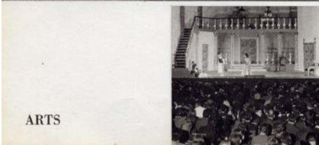
en 1965, le Bourgeois gentilhomme