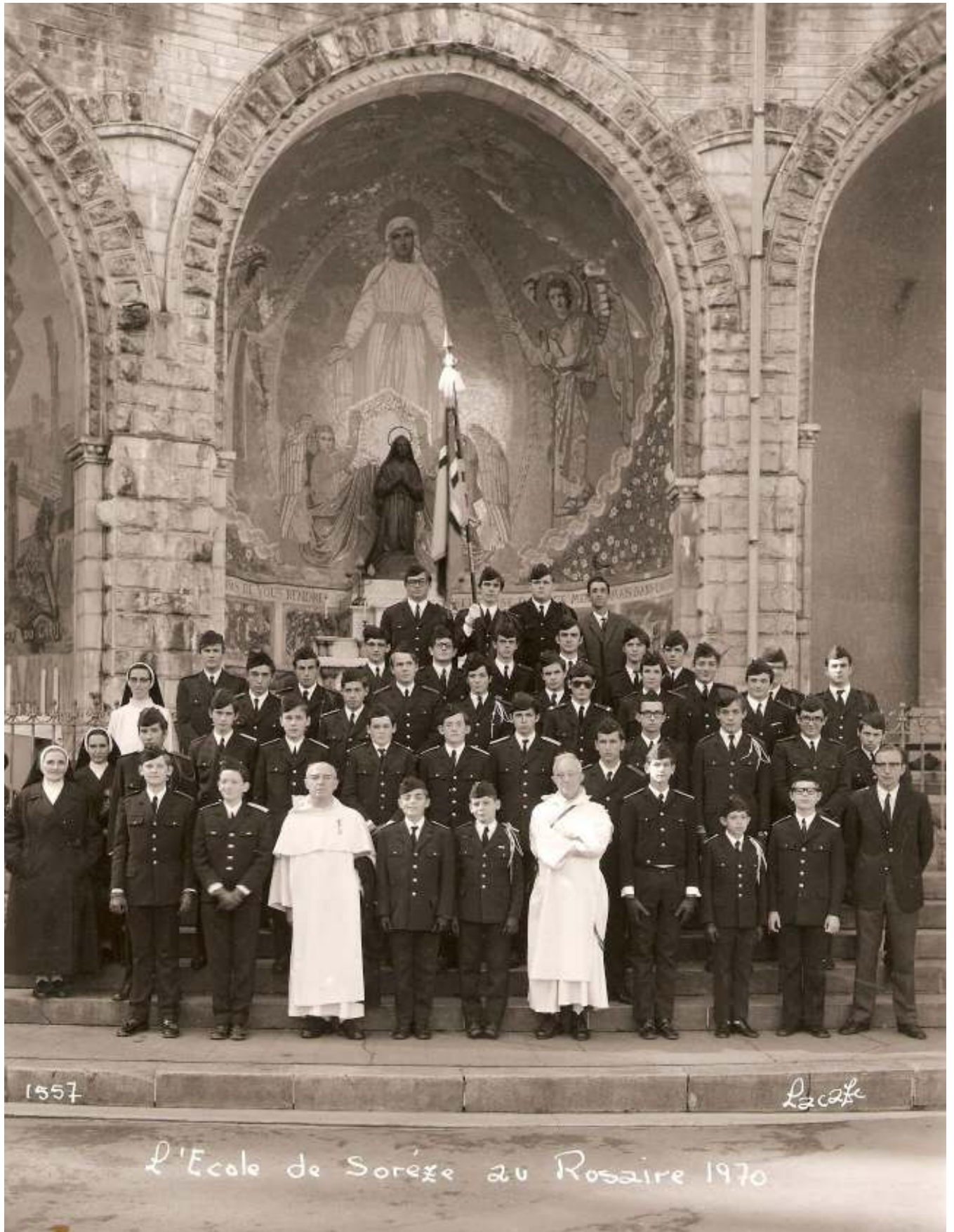
Pèlerinage à Lourdes en 1970