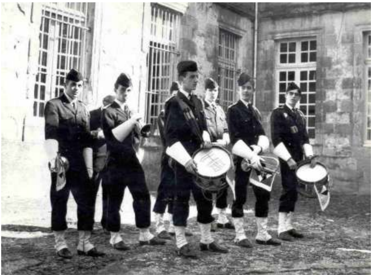
La clique en 1966